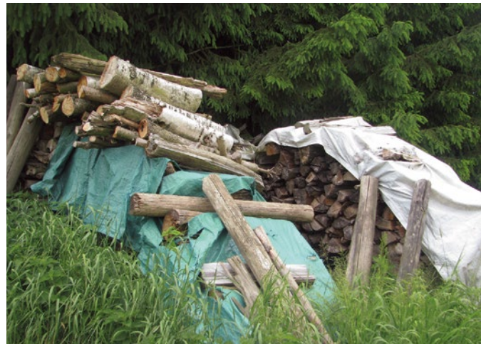
Im Wald gelagertes Brennholz trocknet langsamer aus; es besteht die Gefahr des »Verstockens«.

Heizen Sie nur mit naturbelassenem, lufttrockenem Holz mit einem Wassergehalt von maximal 20%. Sowohl Buche als auch Fichte (bzw. Kiefer) trocknen auf Wassergehalte unter 20% innerhalb eines Jahres – richtige Lagerung vorausgesetzt.