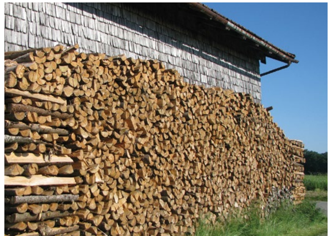
Vorbildlich gelagertes Brennholz

Anlaufstellen für Fragen rund um Produktion und Lagerung von Scheitholz sind die Ämter für Ernährung, Landwirtschaft und Forsten und die Zusammenschlüsse der Waldbesitzer. Adressen hierzu finden Sie unter: www.forst.bayern.de